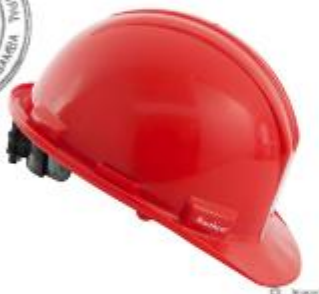
CASO DE SEGURIDAD