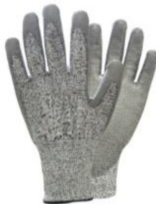
GUANTES DE TRABAJO