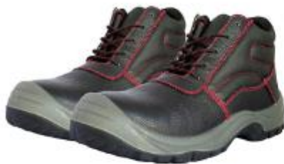
ZAPATOS DE SEGURIDAD TRABAJO – SEGURIDAD