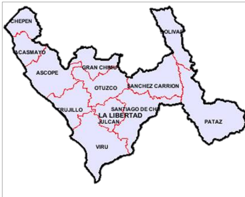
Imagen N° 03: Nivel Provincial - Mapa de la Provincia de Sánchez Carrión con ubicación del Distrito de Huamachuco.