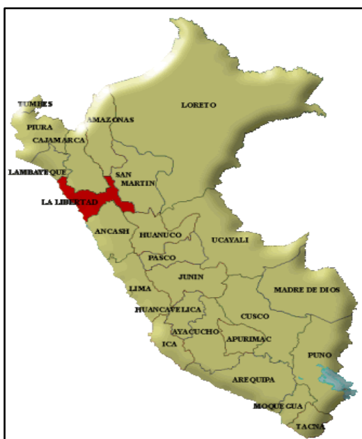
Imagen N° 01: Mapa del Perú con Ubicación de la Región de La Libertad.