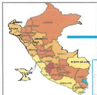
MAPA DEL PERU