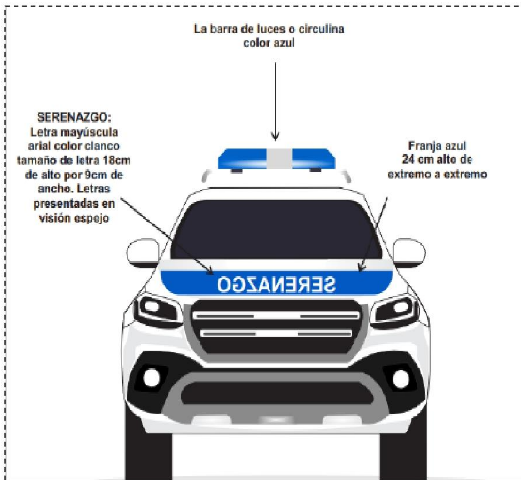
GRAFICO 20: VISTA FRONTAL

a) Camioneta. - Vehículo para el servicio de serenazgo, de cuatro ruedas y cuatro puertas laterales, y de color blanco.