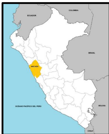
ESQUEMA DEL ÁREA DE ESTUDIO DEL PROYECTO