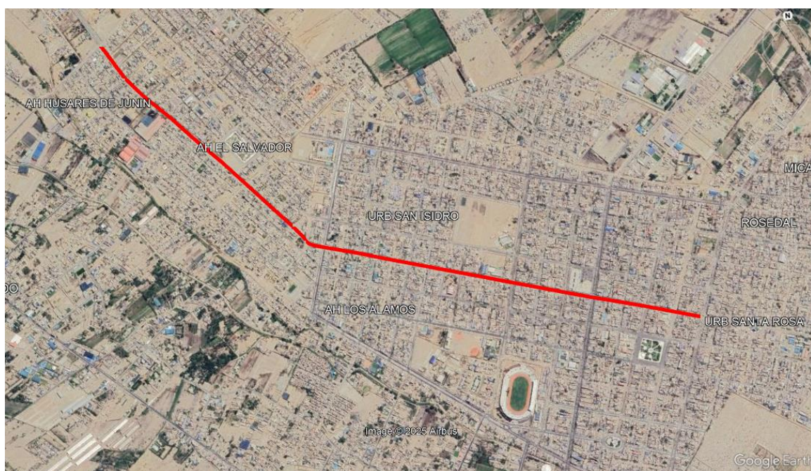
Ubicación del Jirón Sebastián Barranca desde Av. Artemio Molina hasta Av. Carlos Mariátegui