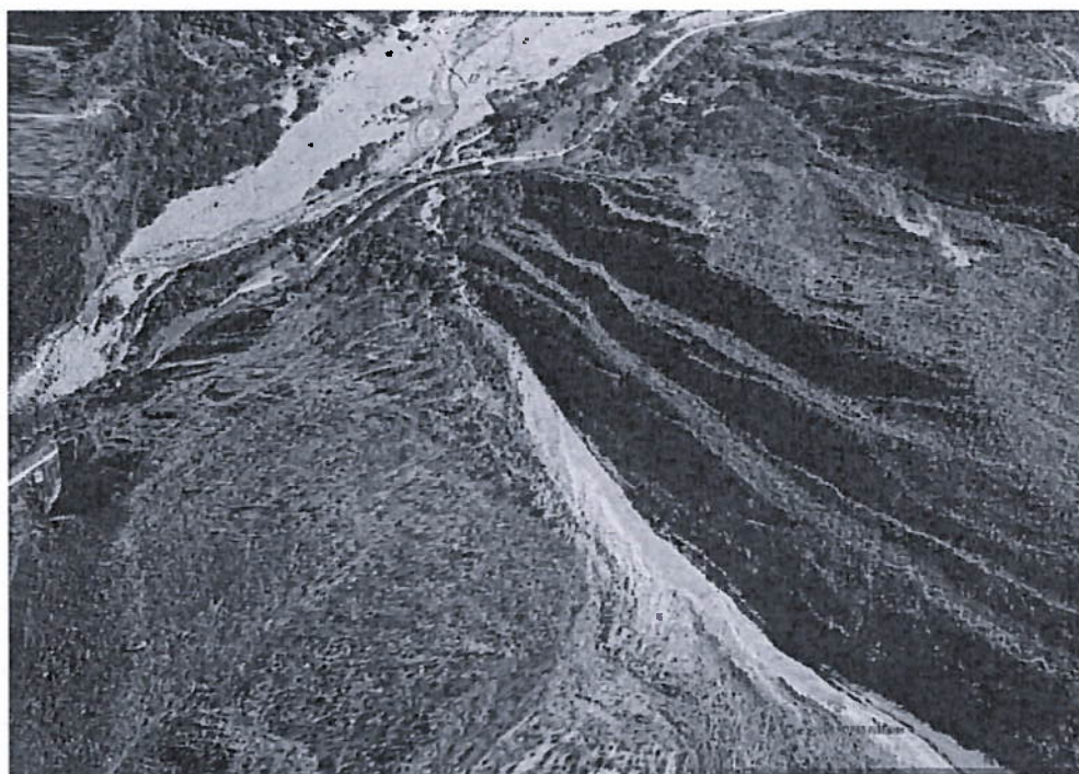
Imagen N° 02 – Tramo II Afectado

TRAMO II INICIO ESTE. 808895.12 NORTE 9248690.45 FINAL ESTE. 808773.05 NORTE 9248604.67