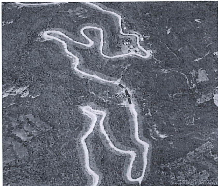
Imagen N° 01 – Tramo I en Peligro

TRAMO I INICIO ESTE 813291.62 NORTE 9245410.49 FINAL ESTE 813249.94 NORTE 9245497.50