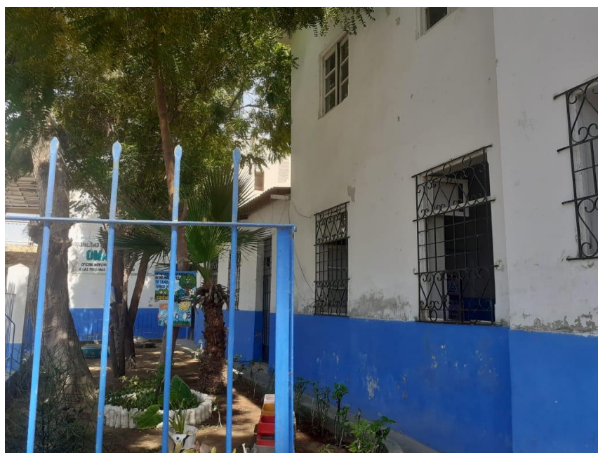
Se muestra la fachada principal de la IE. muros deteriorados por caducidad de vida útil.