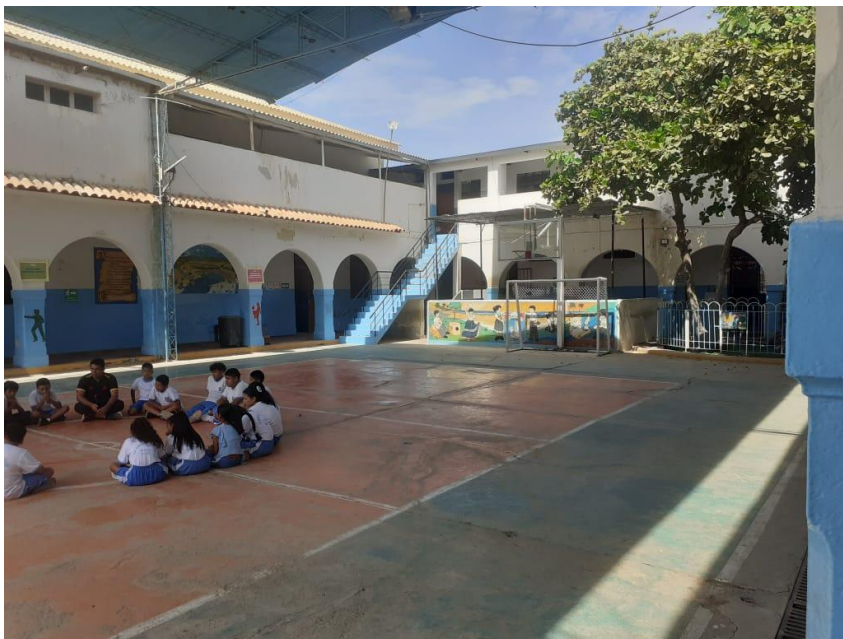
Se muestra el patio de formación de la IE. con presencia de fisuras y grietas.