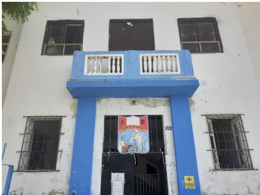
Se muestra la fachada principal de la IE. muros deteriorados por caducidad de vida útil.