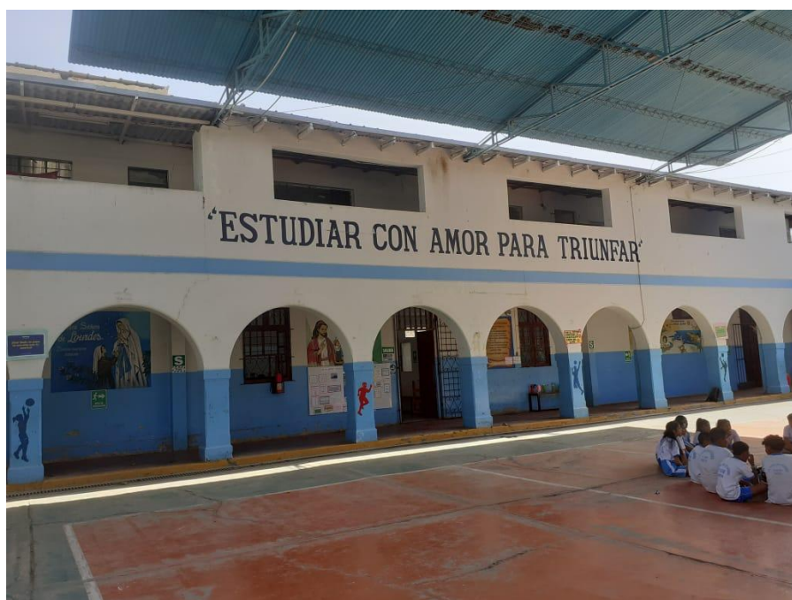
Se muestra el patio de formación de la IE. con presencia de fisuras y grietas.