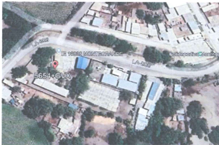
Imagen 1: Ubicación del Proyecto.