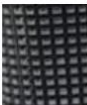
DISEÑO DE TACO