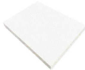
Imagen referencial del Melamine

"Año de la unidad, la paz y el desarrollo"