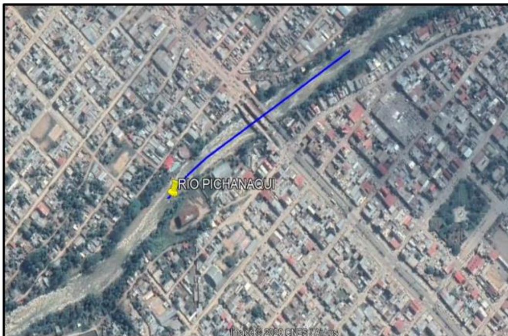
CROQUIS DEL TRAMO A INTERVENIR