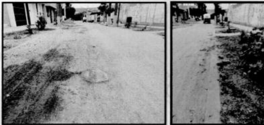
IMAGEN N°05. ESTADO ACTUAL DEL SERVICIO DE TRANSITABILIDAD VEHICULAR Y PEATONAL EN LA CALLE LOS NARANJOS

El presente estudio, nace como resultado de la necesidad sentida de la población, por las inadecuadas condiciones de transitabilidad peatonal y vehicular en la calle Independencia y calle los Naranjos.