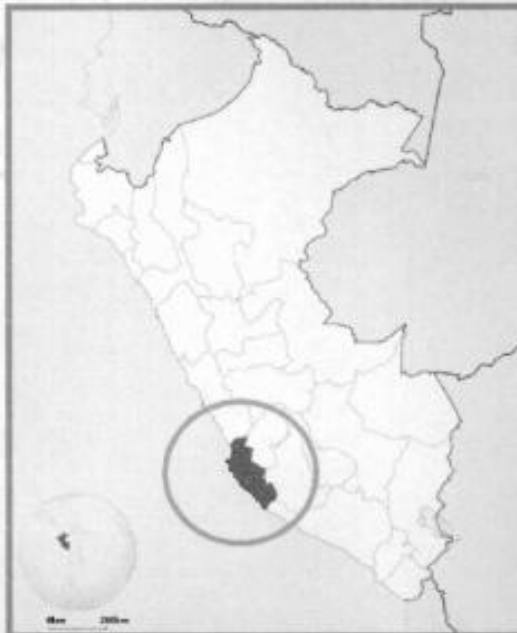
IMAGEN N°01 UBICACIÓN DE LA REGIÓN ICA EN EL PERÚ