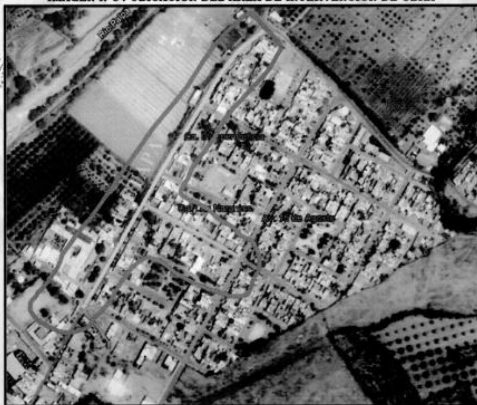
IMAGEN N°04 UBICACIÓN DEL ÁREA DE INTERVENCIÓN DE OBRA