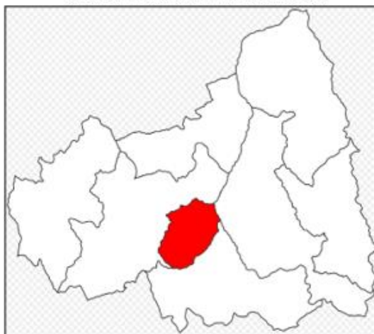
IMAGEN N° 03: DISTRITO DE CURGOS