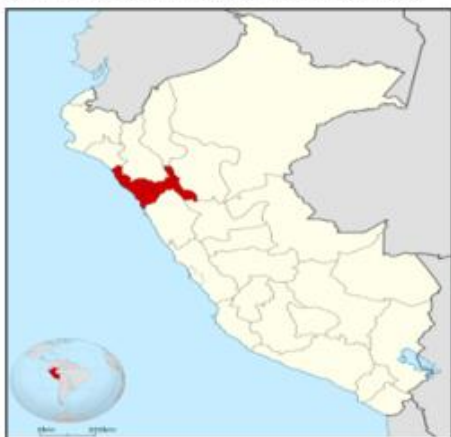
IMAGEN 01: DEPARTAMENTO LA LIBERTAD