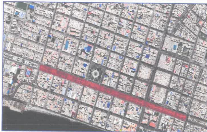
Imagen N°01.- Imagen Satelital, AV PARDO (TRAMO AV. AVIACIÓN HASTA LA AV. GUILLERMO MOORE) (dentro de la sección de color Rojo)