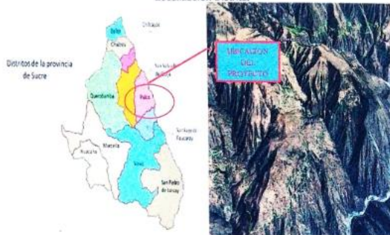
Figura: Localización Tramo