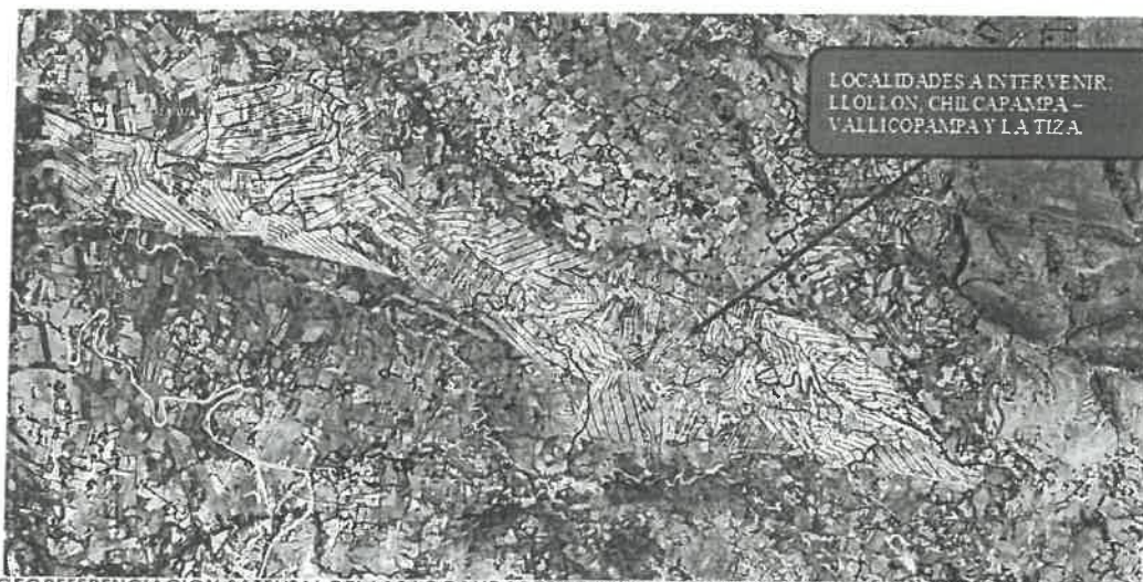
GEOREFERENCIACIÓN SATELITAL DEL LAS LOCALIDADES DE LLOLLÓN, CHILCAPAMPA - VALLICOPAMPA Y LA TIZA S/E

"AÑO DEL BICENTENARIO, DE LA CONSOLIDACIÓN DE NUESTRA INDEPENDENCIA, Y DE LA CONMEMORACIÓN DE LAS HEROICAS BATALLAS DE JUNÍN Y AYACUCHO"