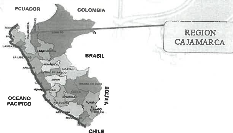
ESQUEMA N°01. UBICACIÓN DE LA REGION CAJAMARCA EN EL MAPA DEL PERU.

Teléfono: (076) 5580372 E-MAIL: muniprovinciamarcos@munisanmarcos.gob.pe H. Leoncio Prado # 360 San Marcos – Cajamarca