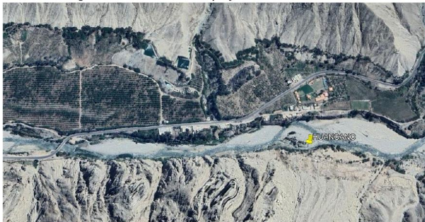
Figura N° 3: Vista satelital del proyecto en el sector Huáncano

"Decenio de la Igualdad de oportunidades para mujeres y hombres" "Año del Bicentenario de nuestra independencia, y de la conmemoración de las heroicas batallas de Junín y Ayacucho"