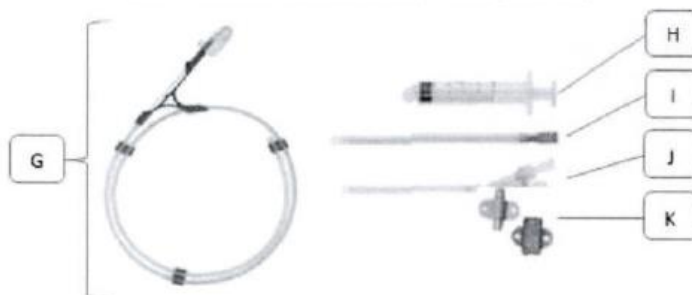
Figura 1. Catéter doble lumen (No incluye diseño)

G: Guía; H: Jeringa; I: Dilatador; J: Aguja introductora; K: Fijador de sujeción