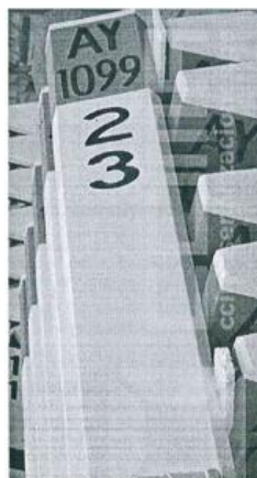
Imagen referencial N°02

Se pintará las progresivas de fondo color blanco, letras color negro, y escritura de la siguiente manera por ejemplo 02+300 .