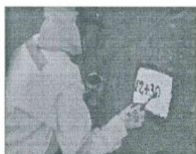
Imagen referencial N°01

Se pintará las progresivas de fondo color blanco, letras color negro, y escritura de la siguiente manera por ejemplo 02+300 .