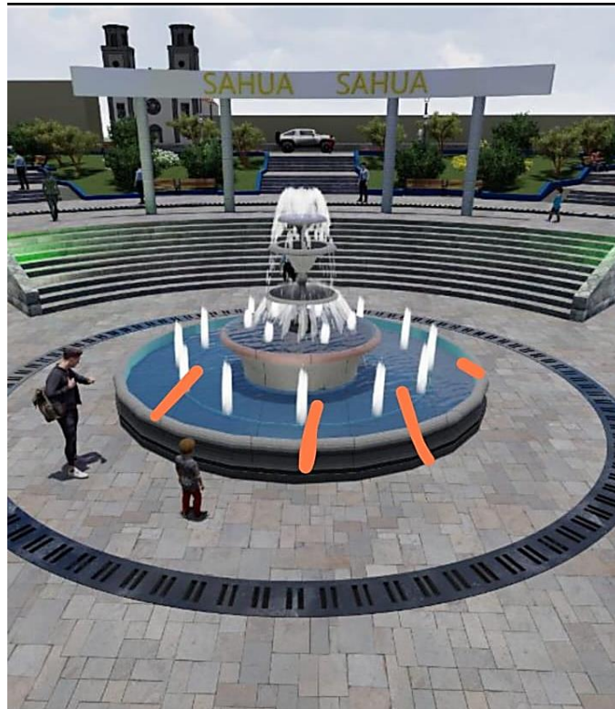
DISEÑO DE LA PILETA DE LA PLAZA