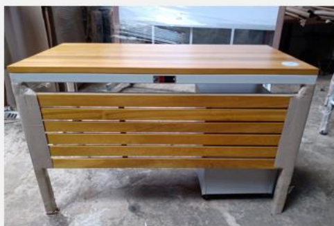
SILLA Y MESA DE DOCENTE