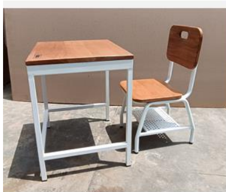
SILLA Y MESA DE ALUMNO PRIMARIA

"CONTRATACIÓN DEL SERVICIO TRANSPORTE Y MONTAJE DE DIEZ AULAS DE EMERGENCIA TIPO DOMO PARA LA INSTITUCIÓN EDUCATIVA BASILIO AUQUI DE LA REGIÓN AYACUCHO, POR IMPACTO DE DAÑOS A CONSECUENCIA DE INTENSAS PRECIPITACIONES PLUVIALES"