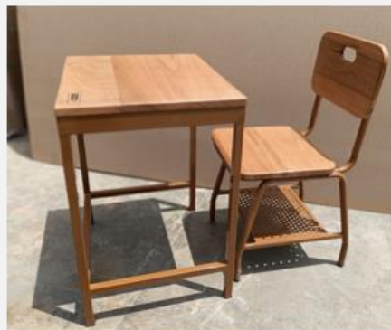
SILLA Y MESA DE ALUMNO SECUNDARIA