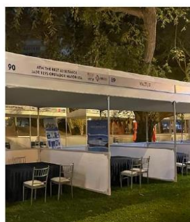
* Imagen Referencial