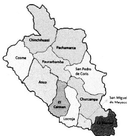
Districts of the province of Churcampa