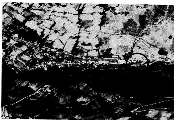
IMAGEN SATELITAL N° 1: UBICACIÓN DE LA I. E. PRIMARIA N° 30960 – HUANCHOS