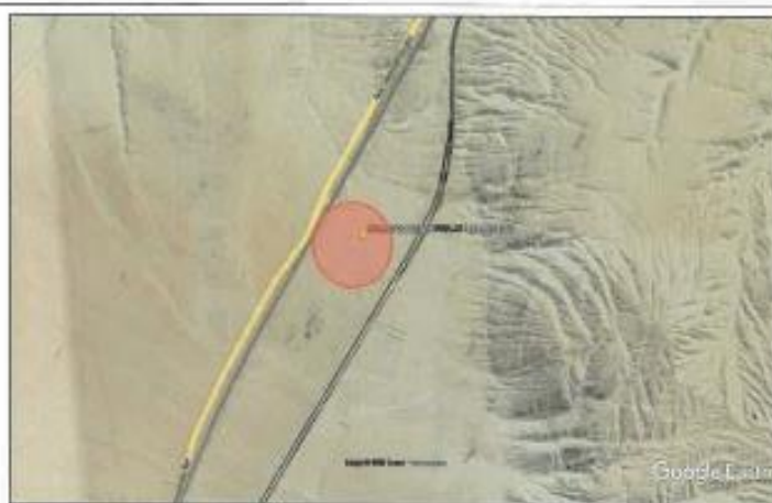
Ubicación propuesta para el campamento peaje lomas Ilo.

Región : Moquegua Provincia : Ilo Distrito : Ilo Sector : Peaje Lomas de Ilo Referencia : SE ENCUENTRA A 2.33 KM ANTES DE LLEGAR A PEAJE DE ILO, LADO IZQUIERDO DESVIO DE TROCHA CARROZABLE A 50 MT.