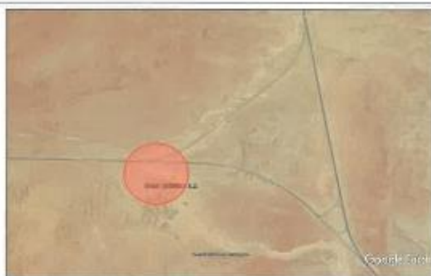
Ubicación campamento desvío a Ilo.

Referencia : CARRETERA PANAMERICANA SUR SEGUNDO DESVÍO A ILO A 56.9 KM DE MOQUEGUA EN DIRECCIÓN A LA CIUDAD DE TACNA