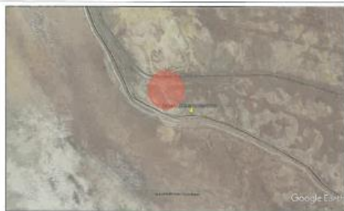
Ubicación propuesta para el campamento Lomas carretera interoceánica.

Referencia : 9.28 KM DESPUES DEL PEAJE DE ILO, UNTIMA CURVA ANTES DE LLEGAR A ILO, DESPUES A LA IZQUIERDA CON TROCHA CARROZABLE DE 560 MT.