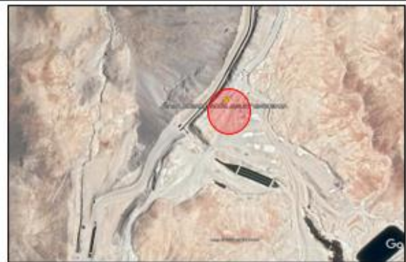
Ubicación campamento desarenador Jaguay Rinconada

REFERENCIA: DESVIO POR YACANGO TROCHA CARROZABLE 8.57 KM.