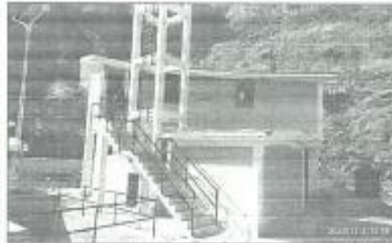
UBICACIÓN CAMPAMENTO OTORA