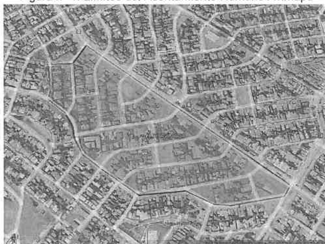
Figura n° 1: Límites del Asentamiento Humano Avimapa

El terreno donde se desarrollará el Expediente Técnico está ubicado en El Asentamiento Humano Avimapa, del Distrito de Ventanilla, Provincia Constitucional del Callao.