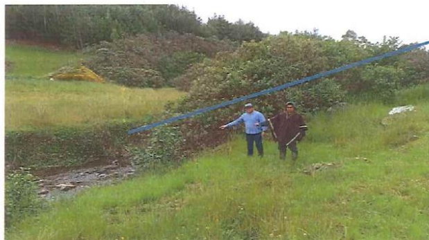
FUENTE DE AGUA DENOMINADA BARRAWIJO