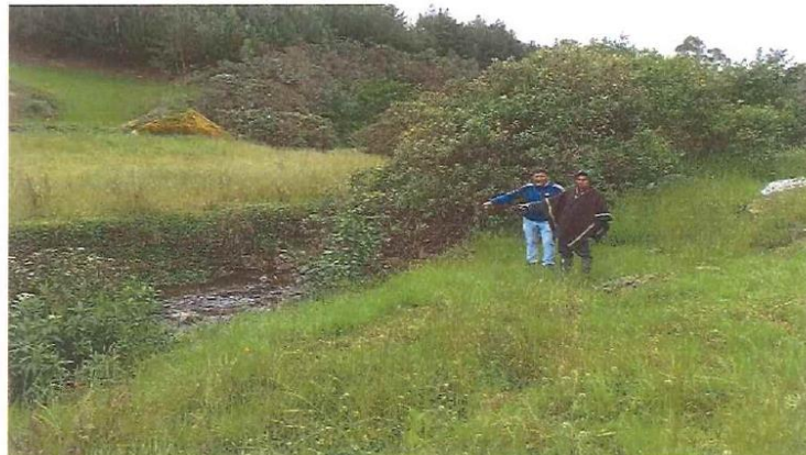
Vista fotográfica del canal San Isidro