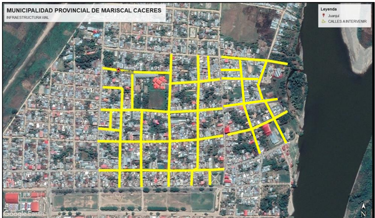
IMAGEN N° 3: ÁREA DE ESTUDIO