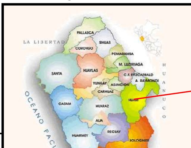
Departamento de Ancash