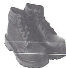
Zapato de seguridad Puntera Acero