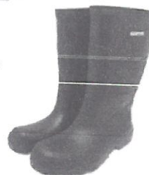
Bota de Jebe

Equipos de Protección Personal (EPPs) los cuales deberán ser reemplazados de acuerdo a la necesidad. En el caso de los cascos de protección estos deben cumplir con los requisitos de absorción de impacto y resistencia a la penetración el personal de mantenimiento deberá usar cascos de color anaranjado, mientras que de los jefes de mantenimiento deberá ser color azul.