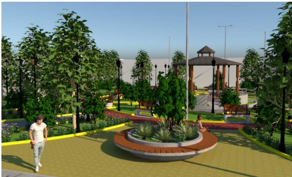
Figura N° 10: Vista de jardineras circulares