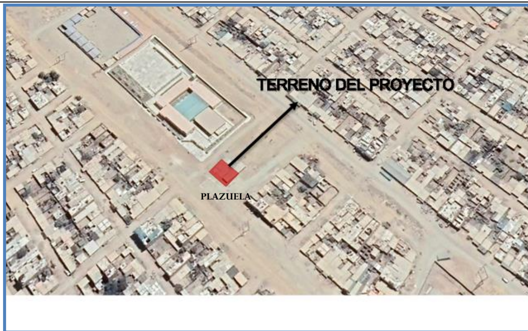
Figura N° 3: