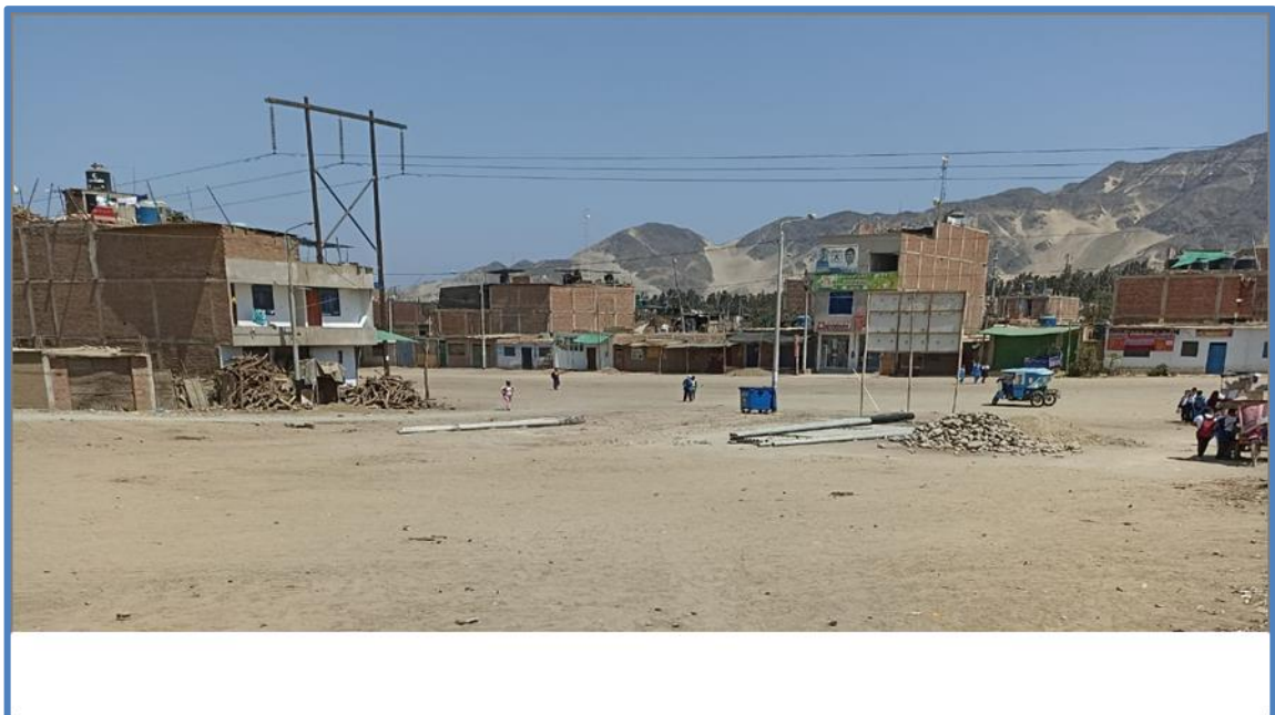
Figura N° 6: Vista de terreno deshabitado