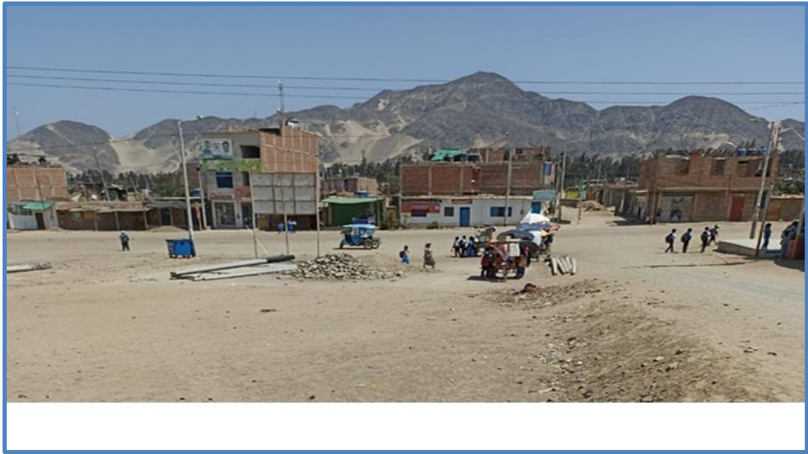
Figura N° 5: Vista de terreno con las calles principales