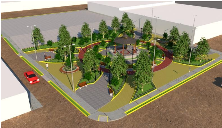
Figura N° 7: Vista General de la Plazuela

Asimismo, en todo el recorrido se contará con BANCAS DE CONCRETO Y MADERA, CON PISOS ADOQUINADOS DE DIFERENTES COLORES, JARDINERAS DE DISTINTAS FORMAS y ARBORIZACION DE VARIAS ESPECIAS; también se instalarán FAROLAS Y POSTES DE 2 FOCOS de alta potencia ubicados en puntos específicos para una buena iluminación; BASUREROS METÁLICOS de reciclaje para una óptima funcionalidad del complejo; y por último se construirá 2 JARDINERAS PEQUEÑAS CIRCULARES que servirán también de bancas para el descanso de las personas, y estarán ubicadas en ambos extremos de la Plazuela Los Arándanos.