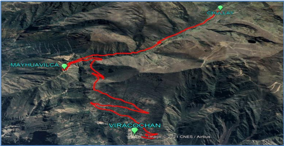
Imagen N°02 Área de influencia de la actividad