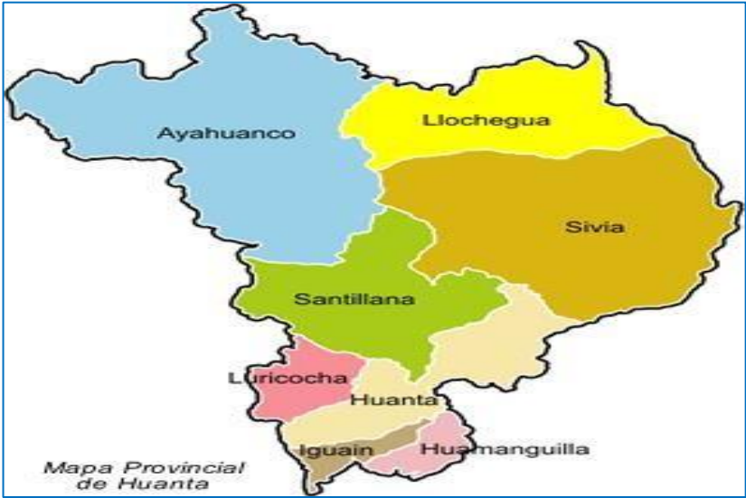
Cuadro N° 04: Localidades del Área de influencia de la actividad