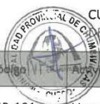
CUADRO N° 02: PRIORIZACIÓN DE ACTIVIDADES DE MANTENIMIENTO RUTINARIO SEGÚN EL ESTADO DEL TIEMPO

De acuerdo a lo anterior se distribuye las actividades a ser desarrolladas durante el año en el siguiente cuadro indica las prioridades establecidas.