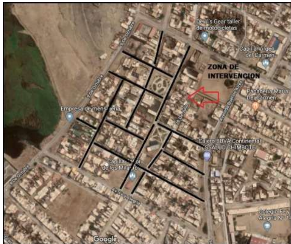
Ilustración 2: Geo Localización del Proyecto