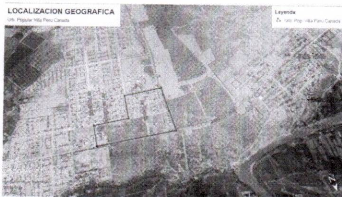
UBICACIÓN A NIVEL DISTRITAL

La propuesta, ha considerado la normativa general – RNE y los parámetros urbanísticos y edificatorios de la localidad para lograr una propuesta de solución que cumpla con los requerimientos y estándares que el sector requiere.