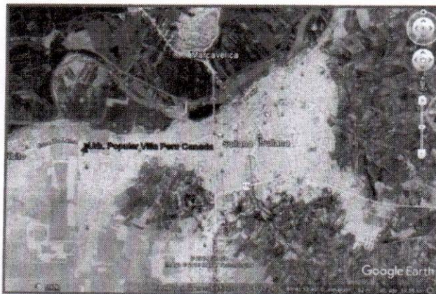
UBICACIÓN A NIVEL PROVINCIAL