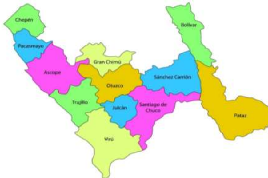
Figura N° 02 Ubicación zona del proyecto Víctor Larco