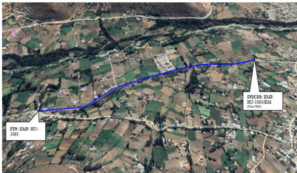
TRAMO 3: EMP. HU-1093 (KM 00+280) - SAN CRISTÓBAL DE HUAYLLABAMBA - EMP. HU-1093. L= 1.435 KM. HU-1094.

JR. 28 DE JULIO NRO. 1363 INT. 1367-Huanuco E-mail: ivp_huanuco_2018@outlook.com