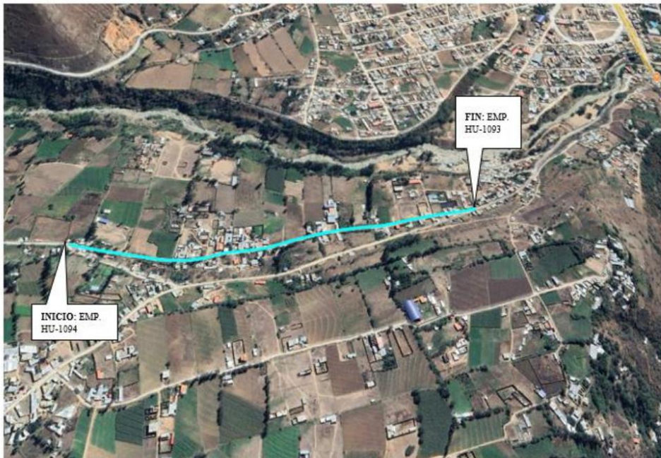
TRAMO 2: EMP. HU-1094 - CHACAPAMPA - EMP. HU-1093. L= 0.935 KM. R-1001108.

"Decenio de la Igualdad de Oportunidades para Mujeres y Hombres" "Año de la unidad, la paz y el desarrollo"