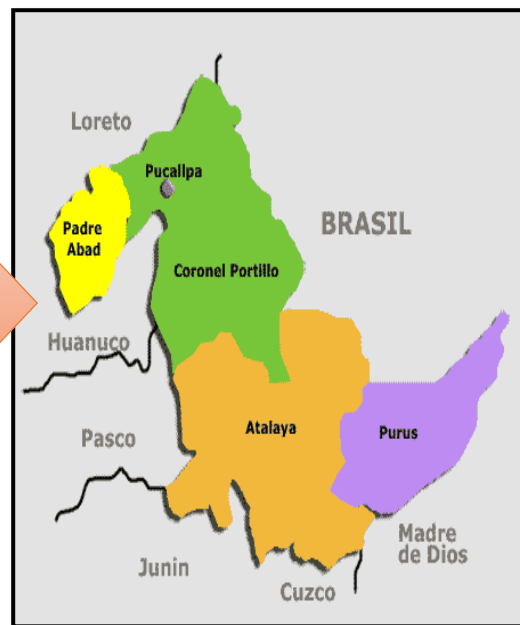
Mapa macro localización del departamento de Ucayali