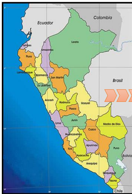
Mapa de macro localización del Perú