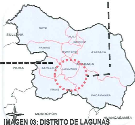
IMAGEN 03: DISTRITO DE LAGUNAS