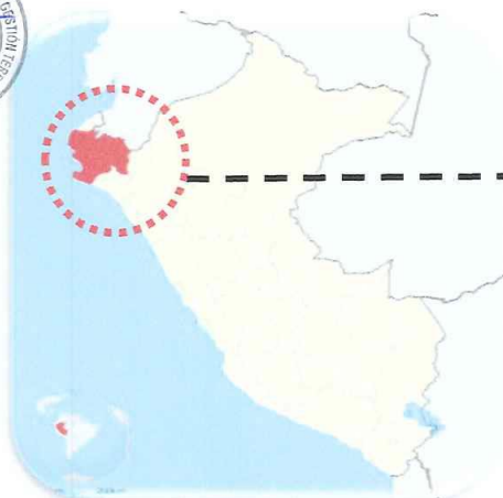
IMAGEN 02: PROVINCIA DE AYABACA