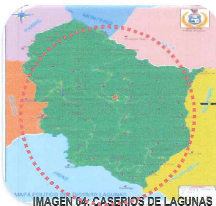
IMAGEN 04: CASERIOS DE LAGUNAS