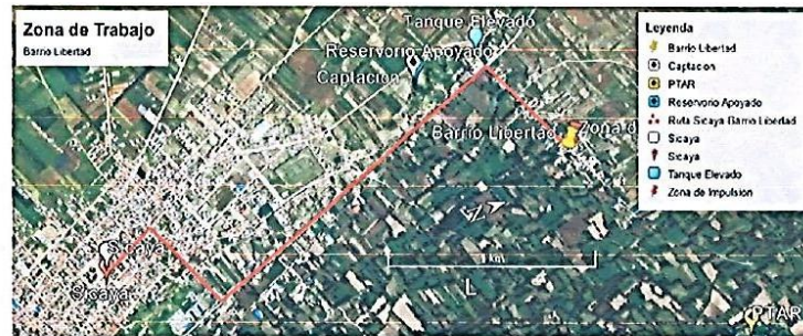
Imagen Satelital de la zona de trabajo (barrio La Libertad)