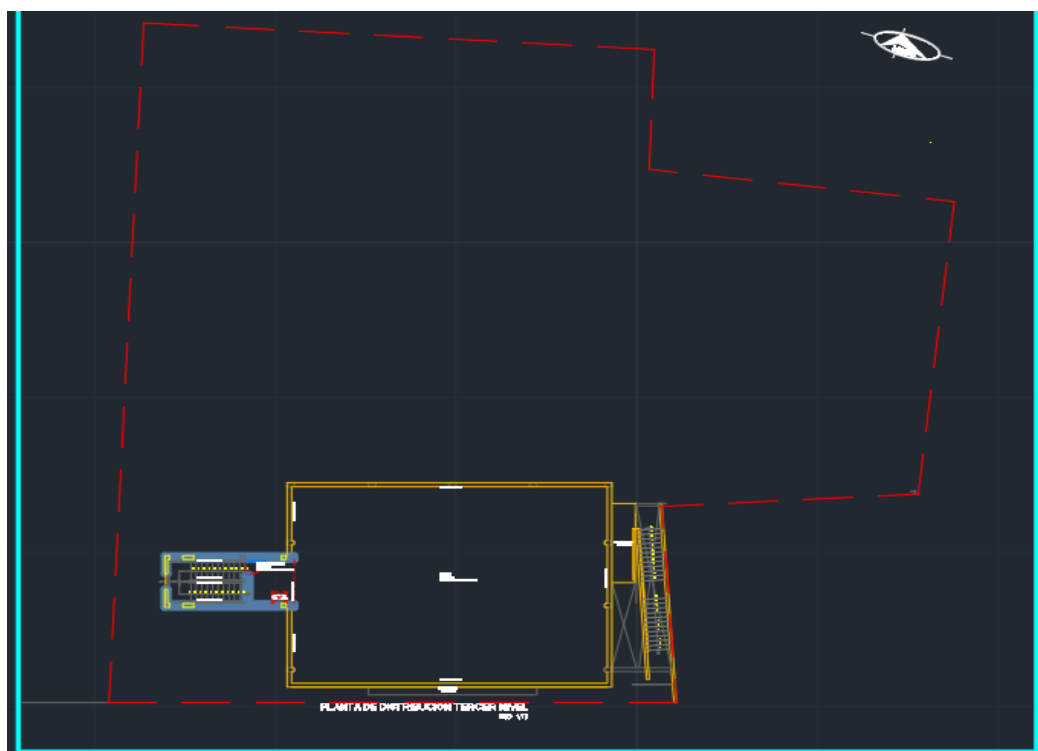
PLANTA DE DISTRIBUCION TERCER NIVEL - ETAPA II EBO. 1/75