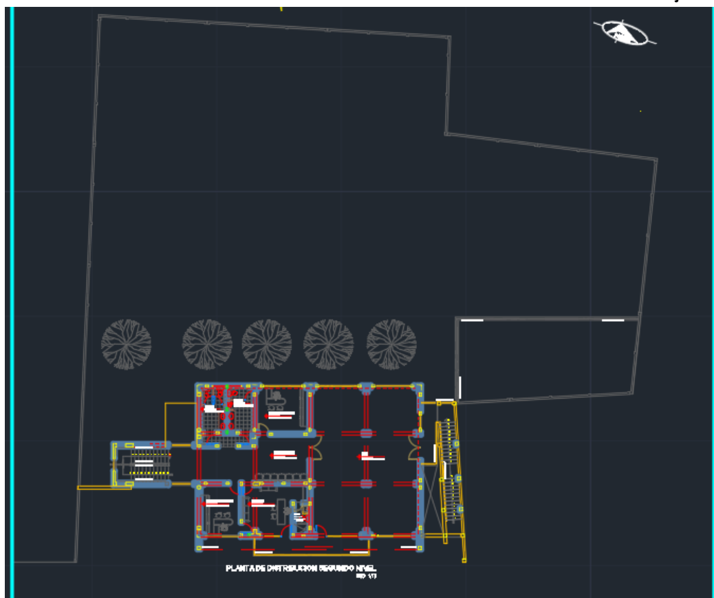
PLANTA DE DISTRIBUCION SEGUNDO NIVEL - ETAPA II EBO. 1/75