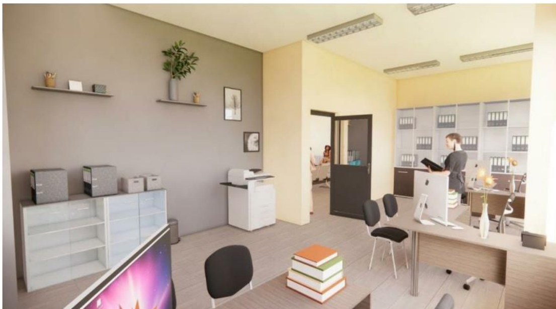
CONTABILIDAD Y TESORERIA