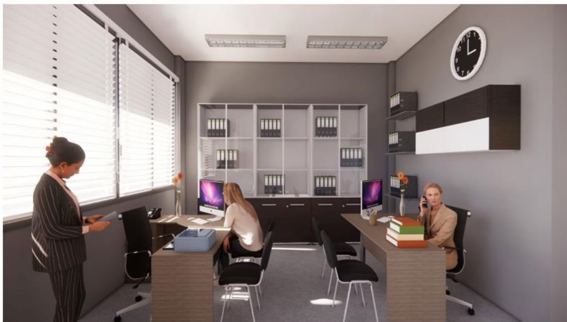
AREA DE DESARROLLO SERVICIOS COMUNALES Y OBRAS