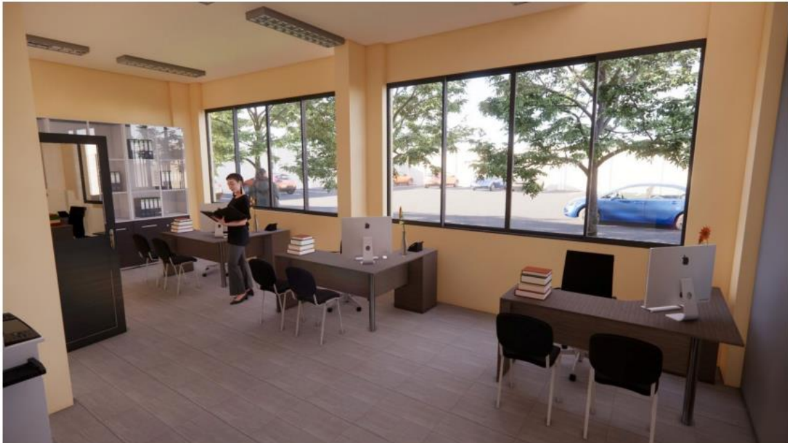
OFICINA DE ABASTECIMIENTO CONTABILIDAD Y TESORERIA