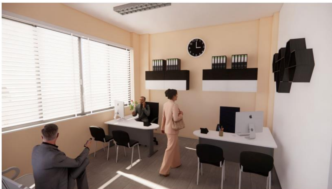
OFICINA DE REGIDORES