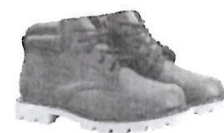
Botines cortos de Jebe