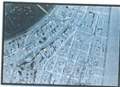
AREA DE INTERVENCION