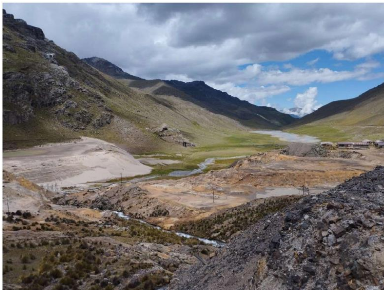
Foto 03: Vista panorámica agua abajo de las Relaveras 9988 y 13063D