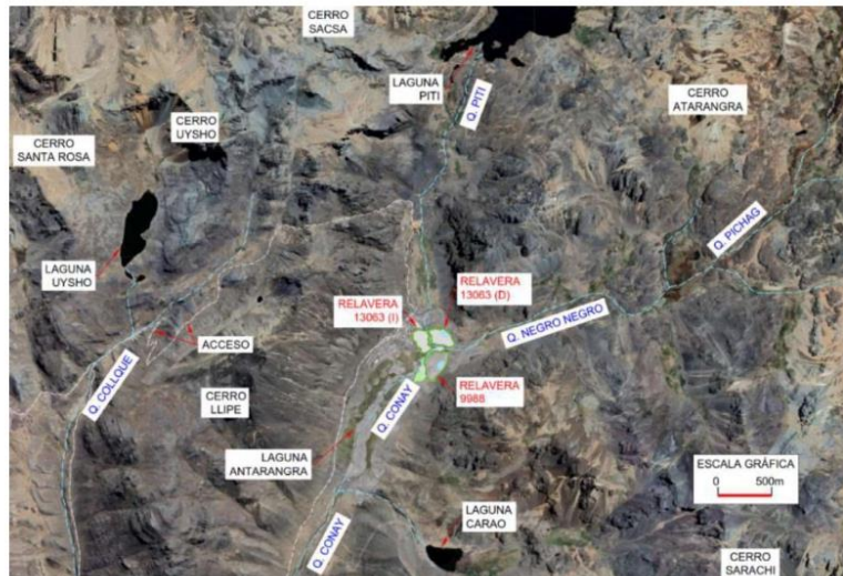
Figura 01: Ubicación de las Relaveras

El acceso al área del proyecto es por vía terrestre, desde Lima a través de la Carretera Central tomando el desvío hacia Callahuanca en Santa Eulalia (Km. 37) hasta Huanza, desde Huanza se pueden tomar dos rutas, la ruta LM-116 o la ruta hacia C.P. Acobamba.