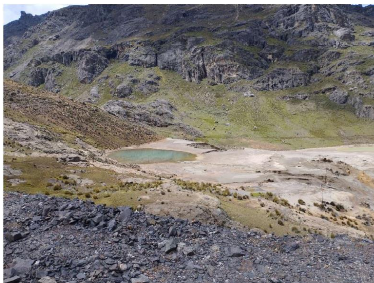
Foto 02: Vista panorámica de las Relaveras 9988 (se observa la laguna de agua acumulada)

Acceda al documento en https://pad.minem.gob.pe/BuscaTuDocumento , clave : ZQ6XRY92