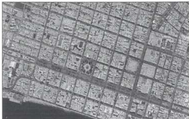
Imagen N°01.- Imagen Satelital. AV PARDO (TRAMO AV. AVIACIÓN HASTA LA AV. GUILLERMO MOORE) (dentro de la sección de color Rojo)

COORDENADAS UTM - DATUM WGS 84 - ZONA 17L