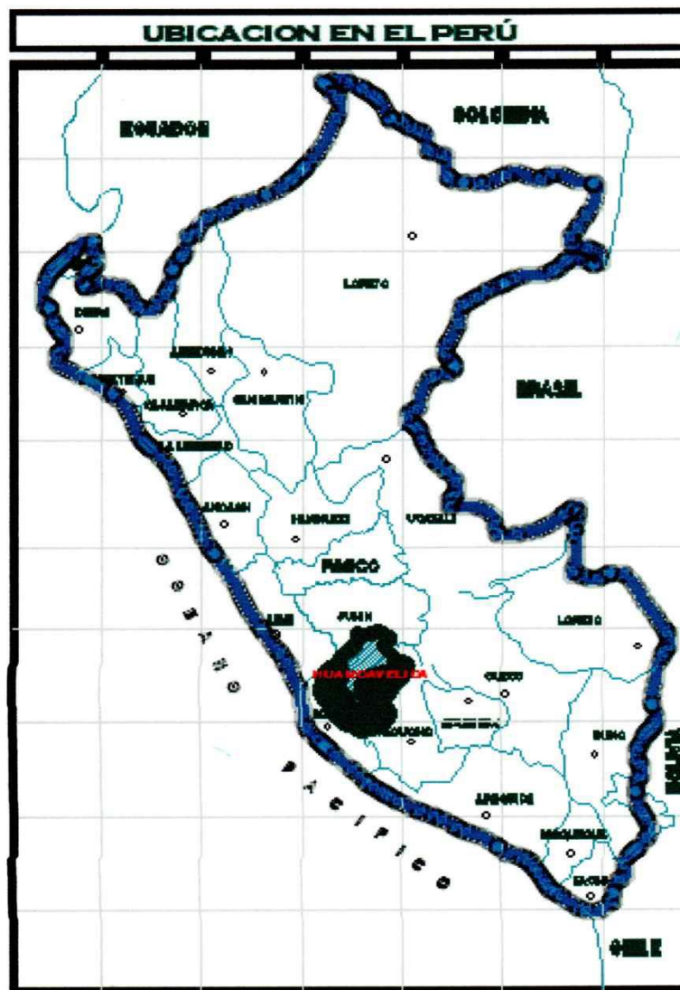
Figura N° 1 - Ubicación política de la Región Huancavelica.

Norte : Con el Centro Poblado San Antonio Sur : Con el Distrito de Acobambilla Este : Con el Distrito de Ascensión - Huancavelica Oeste : Con distrito Acobambilla