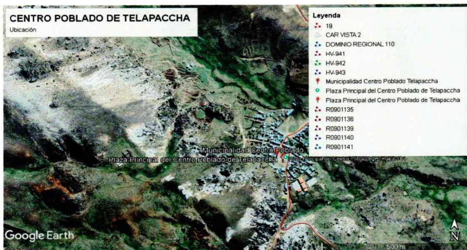
Figura N° 4 - Ubicación política del Centro Poblado de Telapaccha.