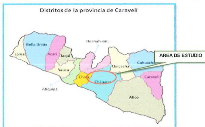
MICRO LOCALIZACIÓN DEL PROYECTO – UBICACIÓN

Plaza Principal S/N. Achanizo – Chaparra – Arequipa Muni.chaparra@gmail.com