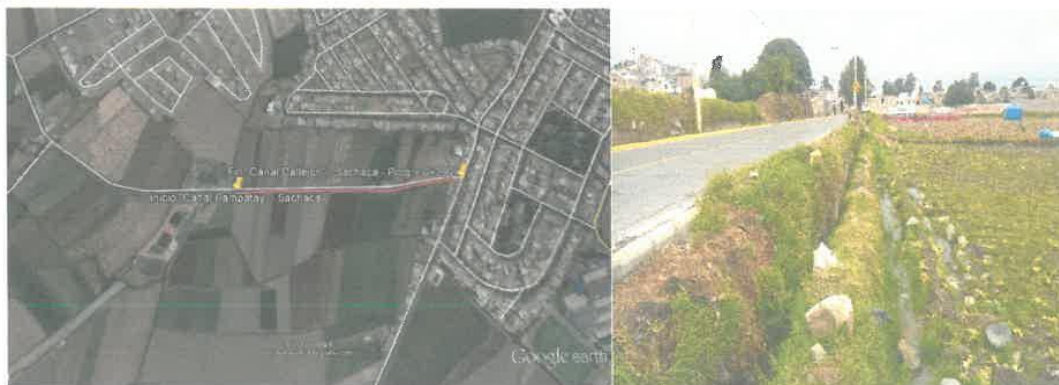
Figura 2 Vista Google Earth Tramo inicial Canal Pampatay.

En el tramo existente se considera obras complementarias como 01 medidor RBC, 04 pases vehiculares, 10 tomas de parcela, 02 tomas laterales, 01 Pase Peatonal.