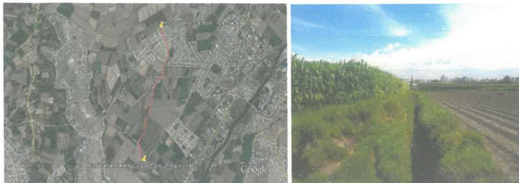
Figura 1 Vista Google Earth y Canal Callejón.