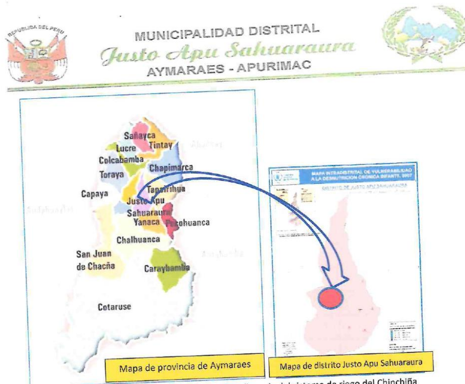
Grafico. Área de estudio y área de influencia del sistema de riego del Chinchifla