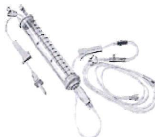
Fig. 1.: Línea para Bomba de Infusión con Volutrol (No implica diseño)